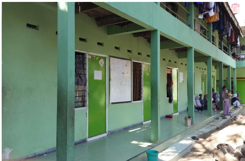
Lokasi Pesantren Miftahul Ulum Kaliwates Jember