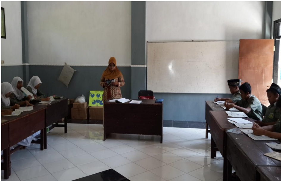
Kegiatan Belajar Mengajar Lembaga Pendidikan Dasar (SD Miftahul Ulum Kaliwates Jember